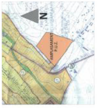
PLAN DE ORIENTARE